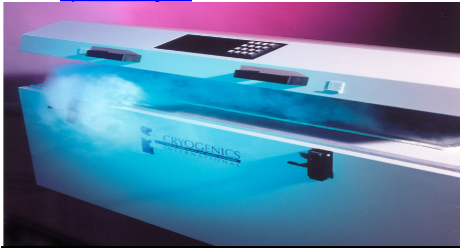
Computergesteuerte Tiefkryogene Ultimate 3 Cryo+ Behandlung von fast allen Materialien und Stoffen